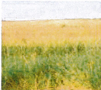
Stavba Poldru a Biocentra 4. 7. 2013