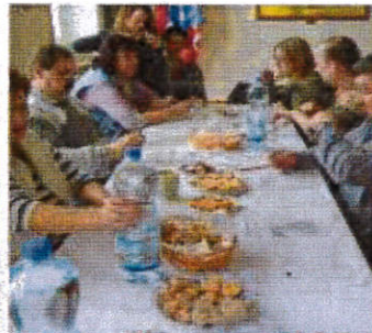
Košť slivovice 2013 14. 4. 2013