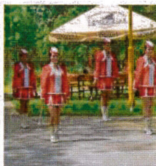
Otevírání šaten 30. 6. 2015