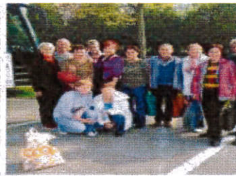
Zájezd MEDER 2012 29. 4. 2012