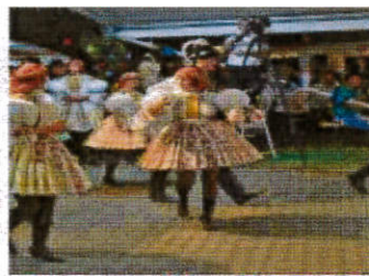
Sušické hody 2011 zábava 24. 6. 2011