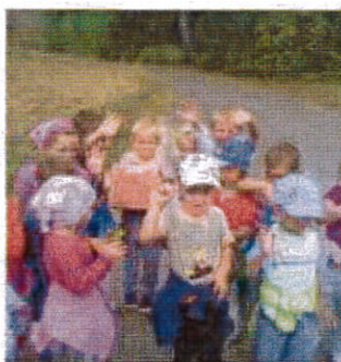
Hledání pokladu 30. 6. 2015