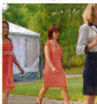
Modní přehlídka 2014 22. 6. 2014