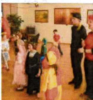
Karneval 30. 6. 2015