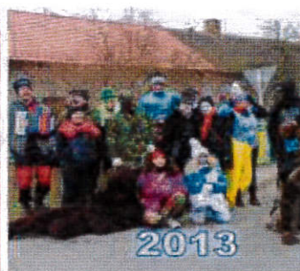
SDH Fašank 2013 4. 2. 2013