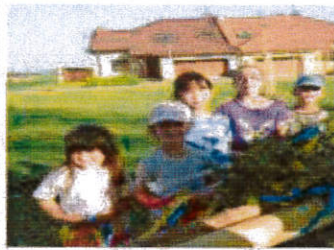
Stavění máje 30.4.2012 1. 5. 2012