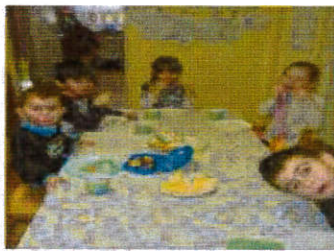
MŠ zima 2011 16. 12. 2011