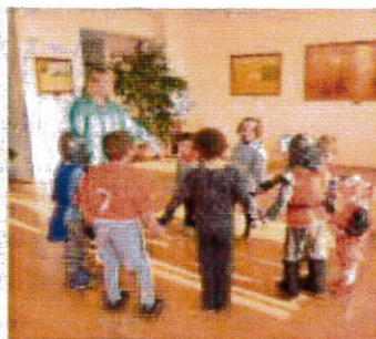
MŠ Karneval 22. 2. 2013