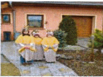
Tříkrálová sbírka 2012 15. 1. 2012