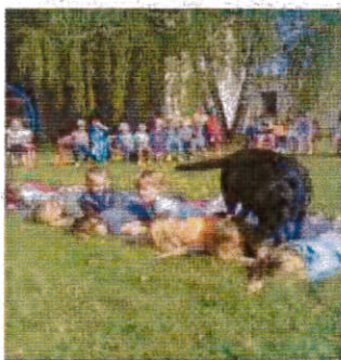
Canisterapie 30. 6. 2015