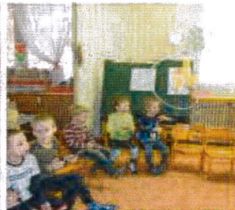
Hudební kroužek 13. 3. 2013