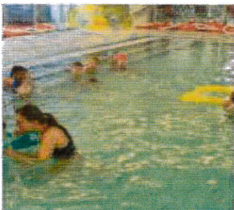
Plavání 12. 3. 2013