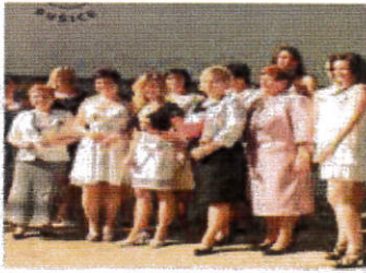
Módní přehlídka 2012 9. 5. 2012